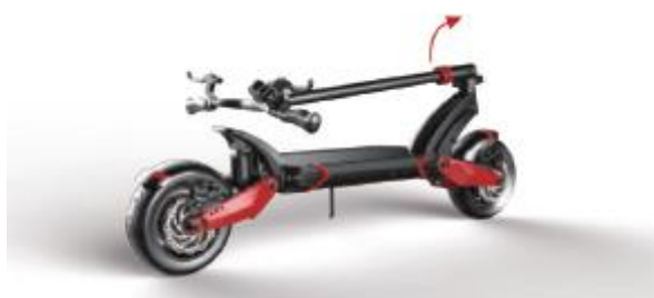
2. Podnieś do góry