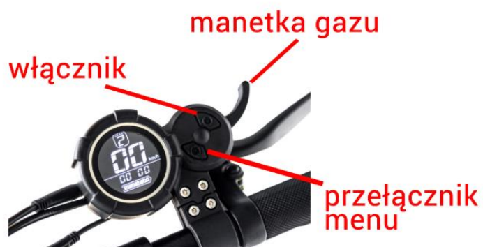
Rysunek 3: Wyświetlacz TIBO Prime, Tibo Prime+, Tibo Epic, Tibo Epic+