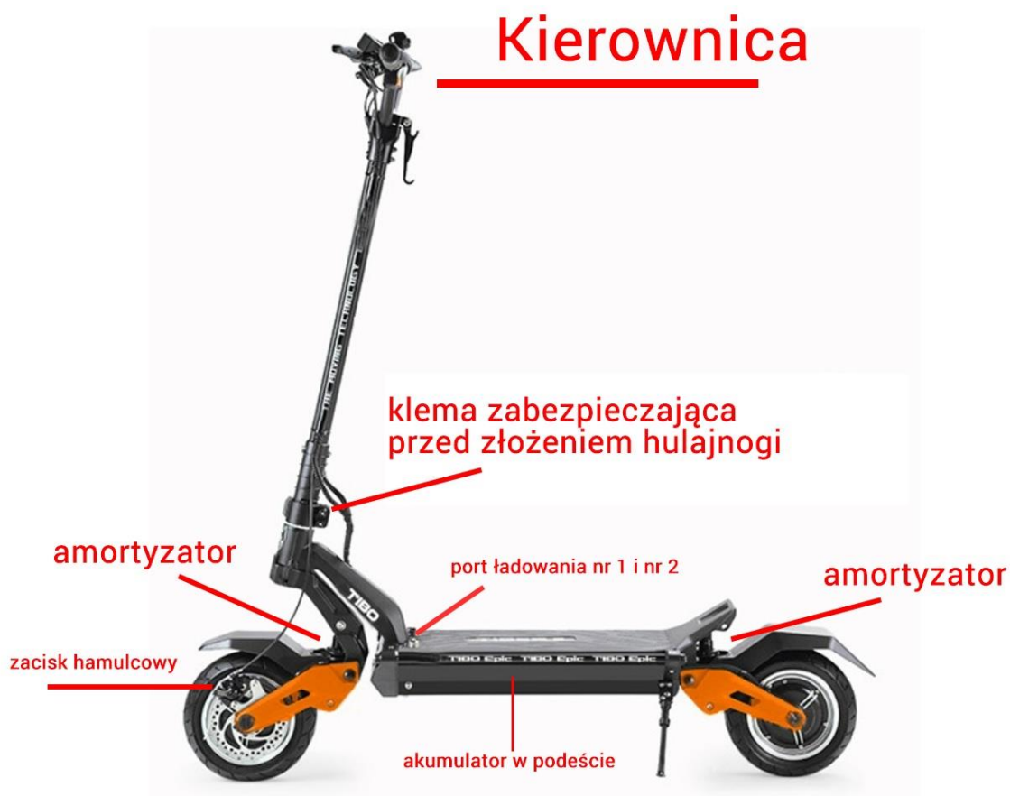
Rysunek 2: Budowa Hulajnoy