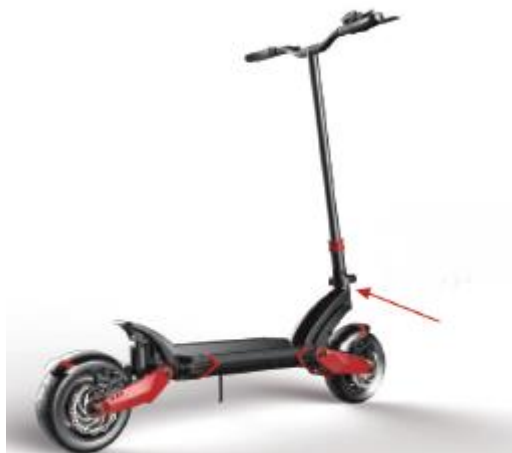
3. Zablokuj uchwyt