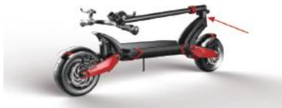
1. Odblokuj uchwyt

Chcąc rozpocząć jazdę konieczne jest rozłożenie hulajnoги. Odbywa się to za pomocą prostego mechanizmu: