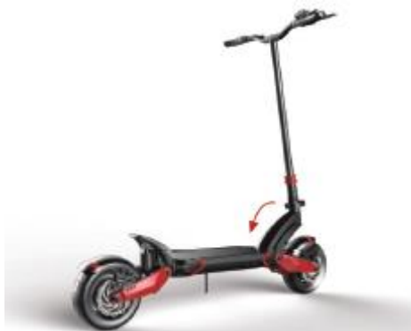
3. Opuść kierownicę w dół