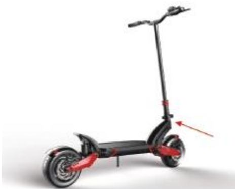
1. Wyłącz zasilanie

Po skończonej jeździe należy złożyć hulajnogę. Należy zwrócić szczególną uwagę, by składanie rozpocząć od wyłączenia zasilania.