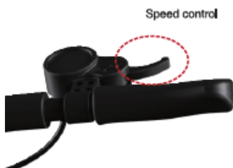
Rysunek 4: Regulacja prędkości

Za pomocą uchwytu użytkownik może kontrolować prędkość w zależności od aktualnej sytuacji panującej na drodze.