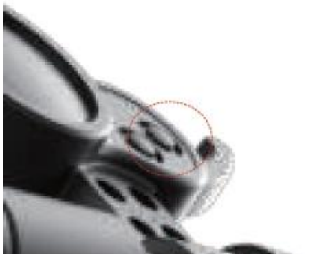
2. Odblokuj uchwyt