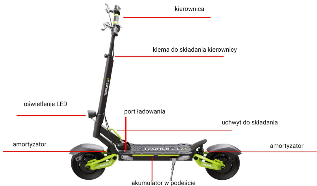
Rysunek 2: Budowa Hulajnoги

Ogólna budowa hulajnoги przedstawiona jest na poniższym rysunku. Rama i części mogą się różnić w zależności od modelu i konfiguracji.