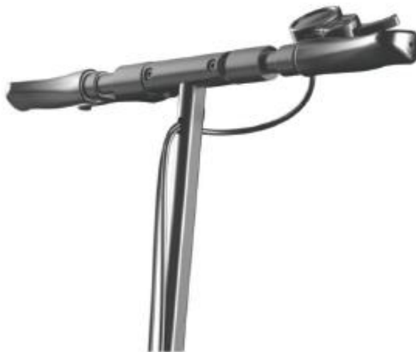
Rysunek 1 Uchwyt